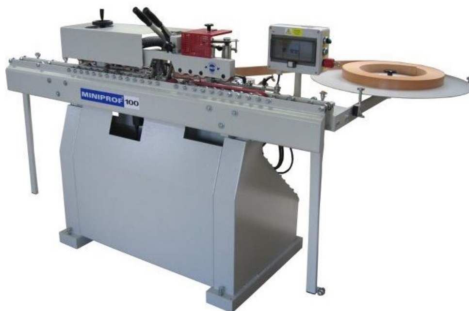
MINIPROF 100, typ ABS 40

POLOCH, s.r.o. Střelniční 349 Frýdek Místek 738 01