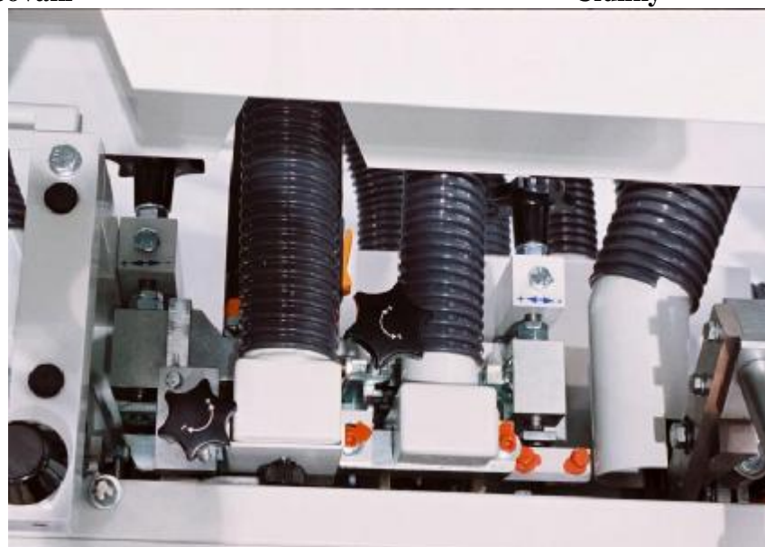
Odsávání od jednotlivých technologických operací